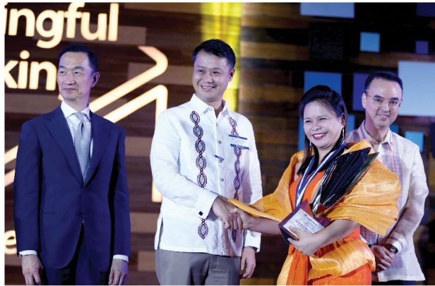
MGA NATATANGING PINOY. Kinilala ang apat na guro, tatlong sundalo at tatlong pulis bilang 2019 Metrobank Foundation Outstanding Filipinos, Lungsod Makati, Set. 4, 2019, kung saan tumayong punong hurado si Senator Gatchalian.