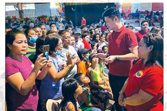
SALOOBIN. Mga bakwit sa PUP Sto. Tomas evacuation center.