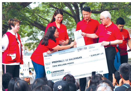
TULONG PINANSYAL. Tinanggap ni Batangas Governor Dodo Mandanas ang ₱2 milyong tulong mula sa Valenzuela City Government.

Subalit naging mabilis ang pag-aksyon ng mga Filipino. Umayuda ang Pamahalaang Lungsod at si Senator Win Gatchalian at nagpaabot ng ₱12 milyong tulong pinansyal para sa mga nasalanta.