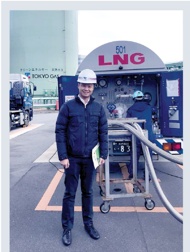
LNG FACILITY SA JAPAN. Personal na inaral ni Senator Gatchalian ang sistema ng Katsuta Liquefied Natural Gas (LNG) Satellite ng Hitachi Katsuta Power Station sa Hitachinaka, Japan, Feb. 28, 2019. Nakapulung din niya ang mga opisyal ng Japan Ministry of Economy, Trade and Industry.