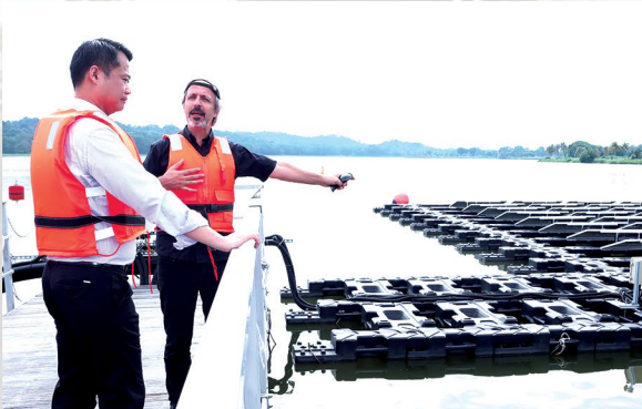
FLOATING SOLAR FARM. Sa eksperimento na ito ng Solar Energy Research Institute of Singapore sa Tengoh Reservoir, ipinapakita na maaaring makapagtayo ng solar farm sa ibabaw ng tubig kung walang sapat na lupang matatayuan nito.