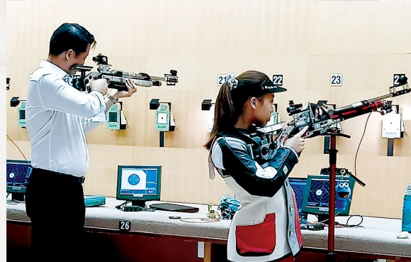
TEST SHOT. Sinusubukan ni Senator Gatchalian ang makabagong pasilidad sa Shooting Academy ng Singapore Sports School.