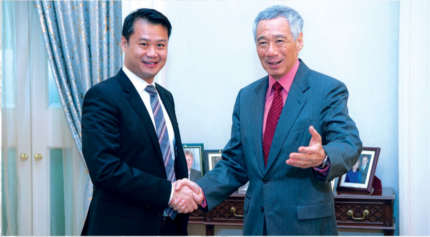
TIGER ECONOMY. Malugod na tinanggap ni Singapore Prime Minister Lee Hsien Loong sa The Istana si Senator Gatchalian upang pag-usapan ang mabuting pamamahala at pagpapalakas ng ugnayang Pilipinas at Singapore.

Binisita ni Senator Win Gatchalian ang Singapore bilang 69th Lee Kuan Yew Exchange Fellow, Okt. 21-26, 2019. Ibinahagi ng pamahalaan doon ang world-class at best practices nito sa pagbibigay serbisyo-publiko gaya ng sa sektor ng edukasyon at youth development, ekonomiya, enerhiya at national defense.