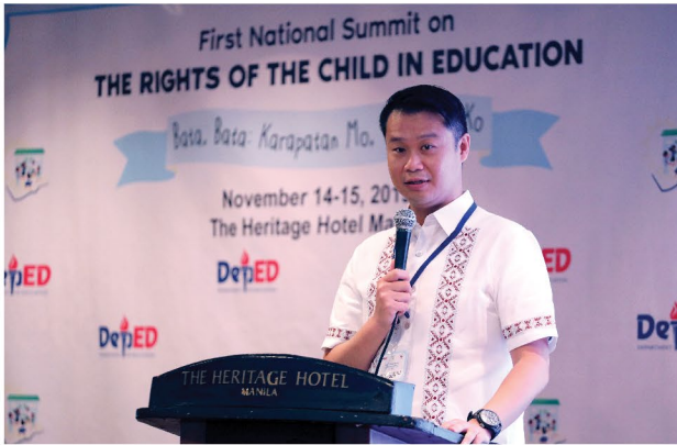
BANTAY EDUKASYON. Pinagtibay ni Senator Gatchalian ang kanyang misyong pangalagaan ang karapatan ng bawat kabataang Filipino para sa dekalidad na edukasyon sa First National Summit on the Rights of the Child in Education sa Pasay City, Nob. 14, 2019. Kasabay din ito ng 30th anibersaryo ng UN Convention on the Rights of the Child.