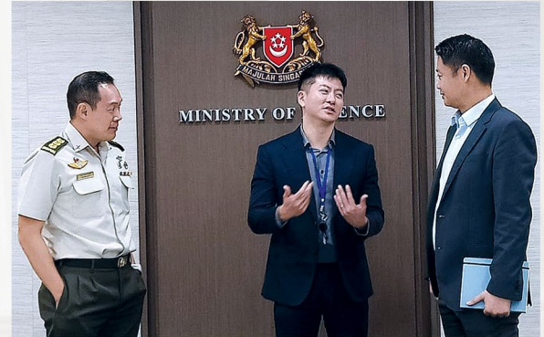
MALIIT NGUNIT MALAKAS. Sa briefing ng Ministry of Defence, tinatalakay ng mga opisyal nito ang National Service program na nagpapalakas ng military, police at civil defense ng Singapore, isang bansang halos singlaki lamang ng Laguna Lake.