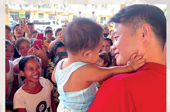
HI BABY! Inaliw ni Senator Gatchalian ang sanggol sa Bernardo Lirio Memorial Central School, Tanauan City.