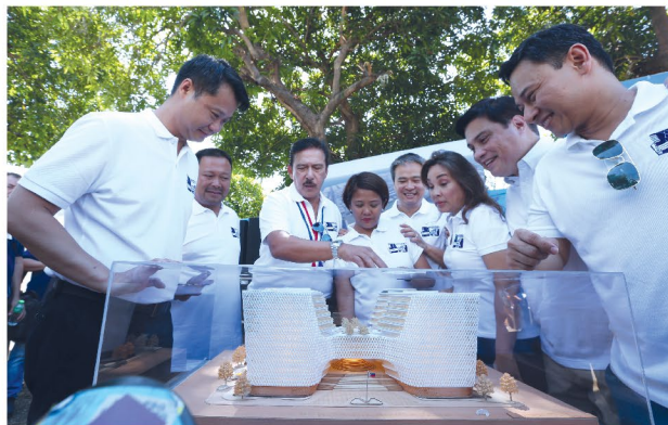
BAGONG SENADO. Groundbreaking ng bago at modernong tahanan ng Senado sa Bonifacio Capital District, Lungsod Taguig, Mar. 18, 2019.