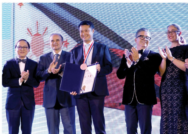
PANGALAWANG INTERNATIONAL AWARD. Matapos ang Devex Manila 40 Under 40 Award noong 2013, nakuha naman ni Senator Gatchalian ang "Great Citizen of the Philippines" Award mula sa Sino-Phil Asia International Peace Awards Foundation, Lungsod Makati, Mar. 6, 2019.