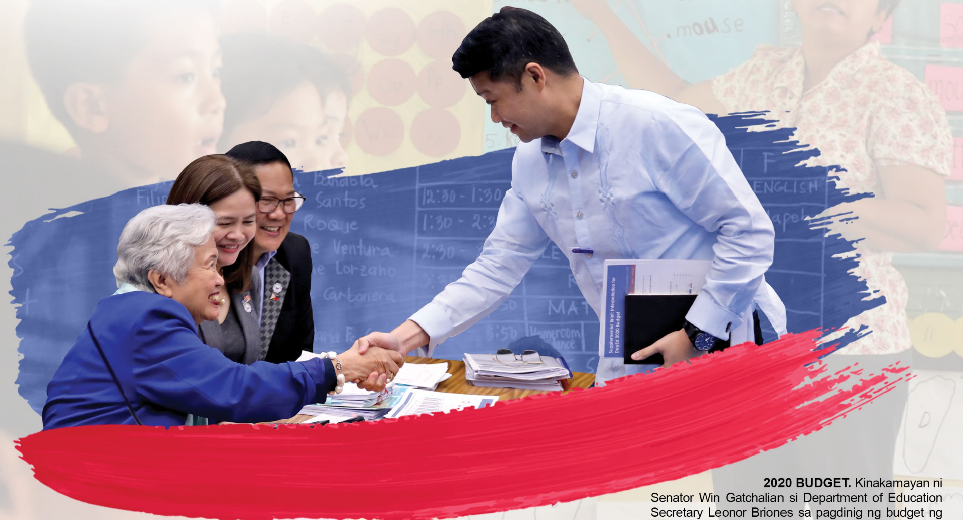
2020 BUDGET. Kinakamayan ni Senator Win Gatchalian si Department of Education Secretary Leonor Briones sa pagdinig ng budget ng ahensya sa Plenaryo ng Senado, Nob.19, 2019.

BAGONG ALTERNATIVE LEARNING SYSTEM, BUBUO SA 24 MILYONG MGA PANGARAP