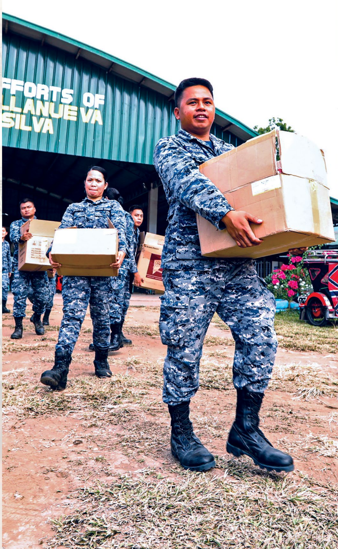
TO THE RESCUE. Mga sundalo dala ang mga relief goods sa Mataas na Kahoy Elementary School.

Nabulabog ang lalawigan ng Batangas, maging ang mga karatig-probinsya at Metro Manila sa pagputok ng Bulkang Taal nitong Enero 12.