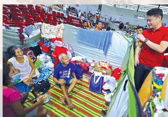
MAY PRIVACY. Gamit ang tent dividers, naging mas maayos at may privacy ang evacuation centers, gaya ng sa Batangas Provincial Sports Complex.